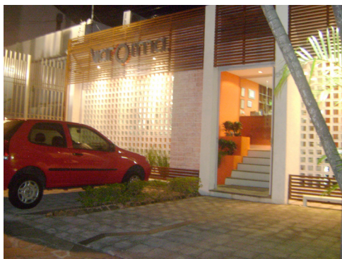
Fachada da ViaForma em 2008.

Sempre atentos ao que o mercado estava fazendo para poderem fazer diferente, passaram a se preocupar com importantes detalhes como a limpeza, que antes era terceirizada. “O cheiro bom. Isso é uma coisa que eu sempre cuidava nas academias em