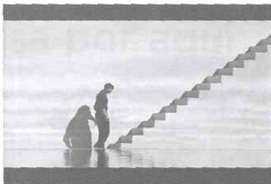
A revelação do mundo editado de Truman: a escada leva à porta de saída da prisão midiática do personagem.

Na seqüência final do filme, temos a iniciativa de Truman de partir para as ilhas Fiji, a qualquer custo, já tendo percebido que suas tentativas anteriores foram sabotadas - mesmo ainda sem ter consciência plena do contexto onde se insere. Truman, em um pequeno barco, tenta vencer o mar que circunda o lugar onde vive e que o afasta do mundo exterior. O mesmo mar que levou seu pai quando era criança, quando caiu do barco onde os dois pescavam. Vencendo todos os obstáculos naturais , as ondas e ventos provocados para contê-lo, Truman chega ao extremo do estúdio montado para comportar sua vida mediada, à parede do cenário que representa o céu - em uma cena que remete à arte de René Magritte, pintor belga (1898-1967).