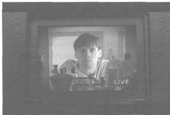
Truman: o homem no espelho, refletido e refratado pela mídia.

Em seguida, mostram Truman em sua prática diária de, ao acordar, dialogar com o espelho do banheiro. Sua imagem é intercalada com depoimentos de pessoas que terão papéis fundamentais no desenvolvimento da trama, como sua esposa, Meryl, e seu melhor amigo, Marlon, como se estivessem sendo entrevistados: sua esposa diz que,