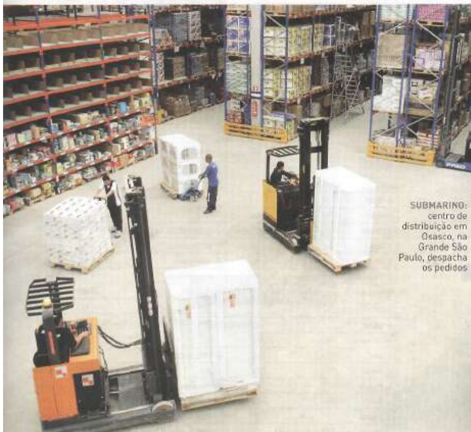
SUBMARINO: centro de distribuição em Osasco, na Grande São Paulo, despacha os pedidos