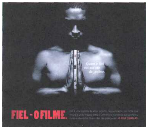
Fiel é uma das fortes apostas da empresa. É a única produção que teve patrocínio

Com exibição em cinemas de todo o Brasil desde 10 de abril, Fiel é uma das fortes apostas da G7 Cinema. Centrado nos anos de 2007 e 2008, o filme acompanha o Corinthians e sua torcida no momento mais difícil da história do clube: a queda para a segunda divisão. Com direção de Andréa Pasquini e roteiro de