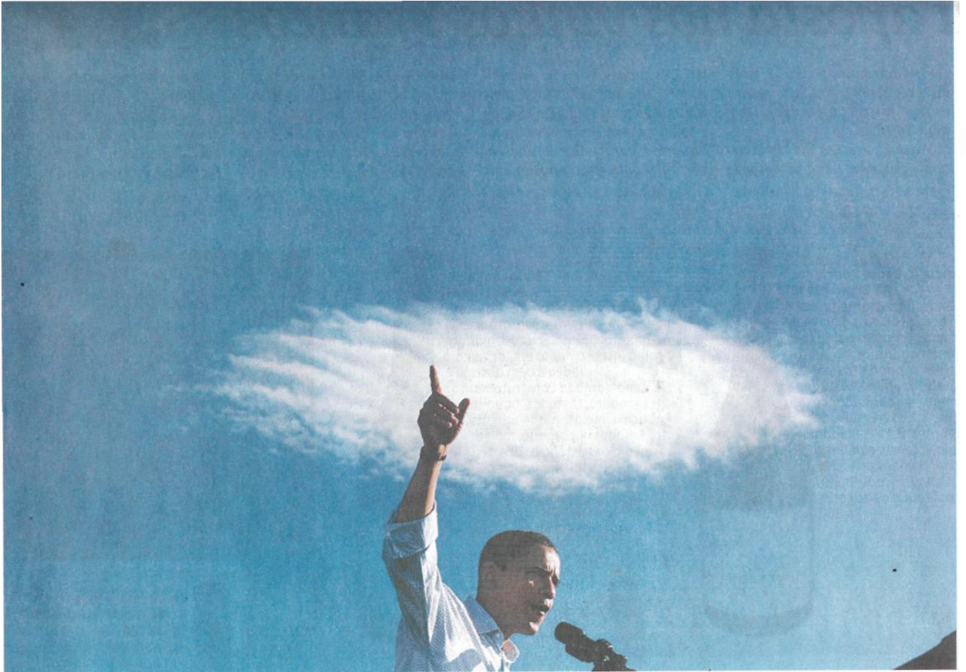
O candidato do Partido Democrata durante um comício de sua campanha à presidência dos Estados Unidos em Pueblo, no Colorado