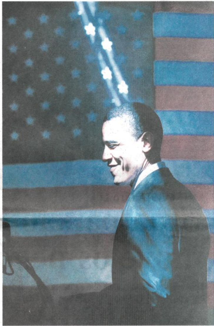
Obama chega à coletiva de imprensa em San Antonio, no Texas