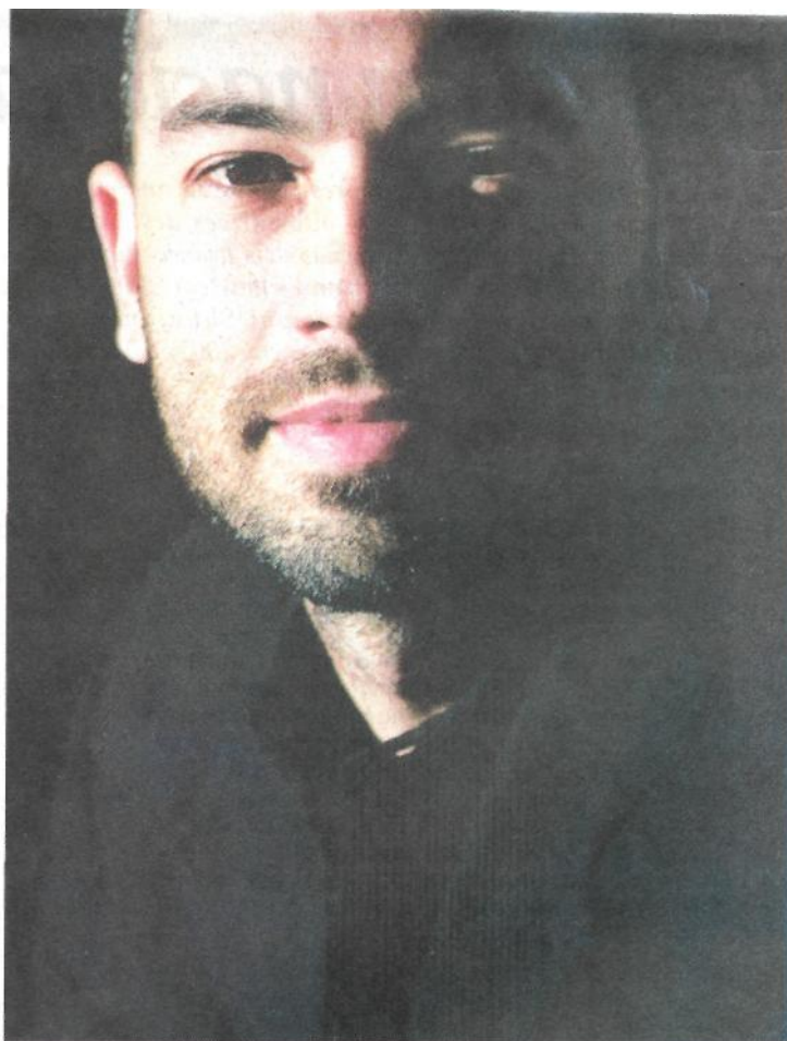
O fotógrafo americano Damon Winter, premiado por seu trabalho