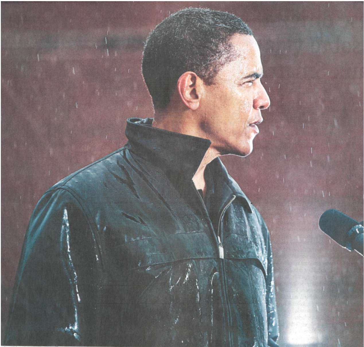
No meio de sua campanha à presidência, Obama enfrenta a chuva em comício organizado na cidade de Chester, na Pensilvânia, em outubro de 2008.