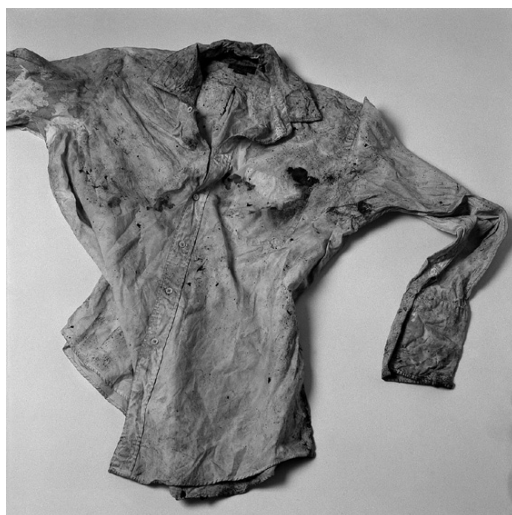
Foto: 'Camisa de mujer asesinada', 1998

El trabajo de García-Alix ha sido ampliamente reconocido. En 1999 obtuvo el Premio Nacional de Fotografía; en 2003, el de PHotoEspaña y, un año después, el Premio de Fotografía de la Comunidad de Madrid.