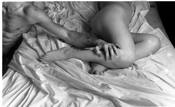
Foto: 'Autorretrato con la mujer que quiero', 1984

Alberto García-Alix (León, 1956) se ha ganado a pulso el título de fotógrafo del exceso. Su propio cuerpo lo pedía a través de sus tatuajes: 'Todo' y 'Nada' fijado con tinta en sus manos. En ellas, su cámara, que también busca el desorden, ha retratado durante décadas el mundo de la noche, la heroína, la prostitución, los personajes... Lo canalla.