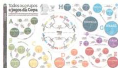
Caderno especial 5.dez.09