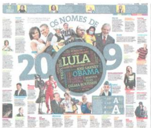
Caderno especial, 30.dez.09