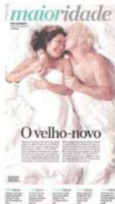
Caderno especial, 15.mar.09