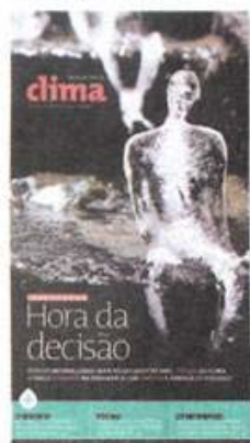
Caderno especial, 6.dez.09