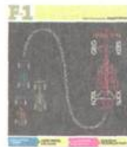
Caderno especial 26.mar.09