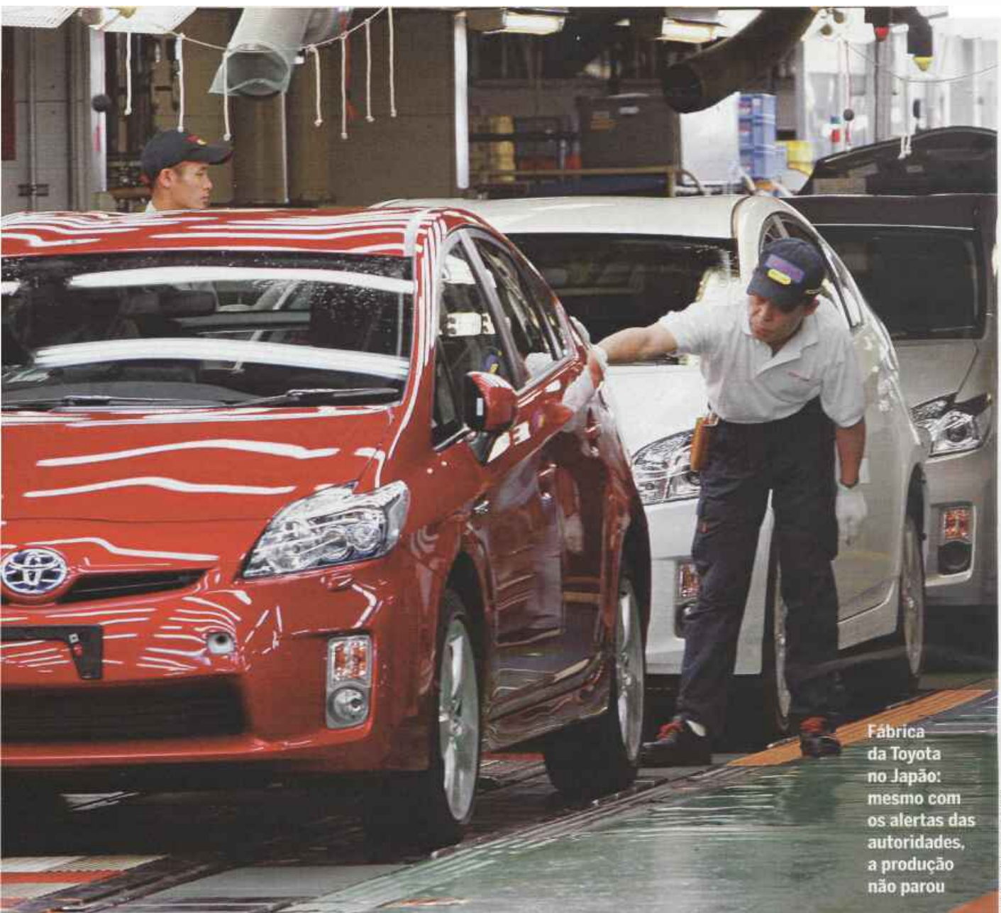
Fábrica da Toyota no Japão: mesmo com os alertas das autoridades, a produção não parou