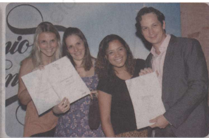
Equipe da Plural recebe prêmio de Empresa de Design do Ano